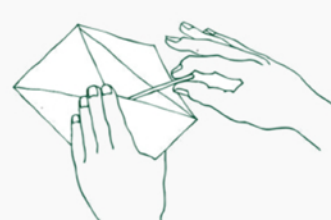
4. Упаковать зонд в конверт, и заклеить

Вынуть три конверта, три зонда-тампона и протокол из общего конверта с адресом ООО «МБЦ».