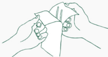
2. Вынуть зонд-тампон