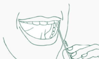
3. Потереть щеку изнутри в течение 30 секунд